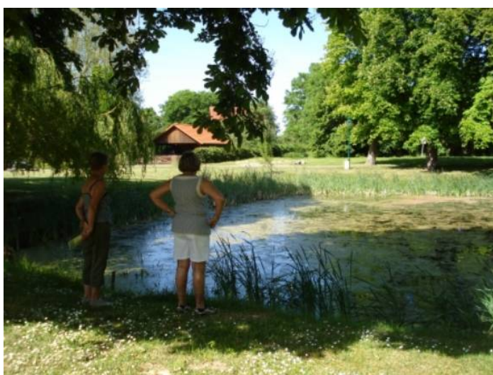
Et kig ud over søen

Men ved 4 tiden om eftermiddagen ebbede aktiviteterne ud – og roen sænkede sig over slottet og omegn. Og resten af tiden var det kun frøernes kvækken fra voldgraven, som brød denne stilhed.