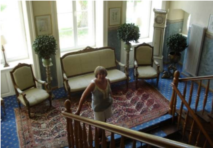
Et afsnit af den store trappe midt i huset

Og det må siges, at den udførte renovering er både smagfuld og gennemgribende.