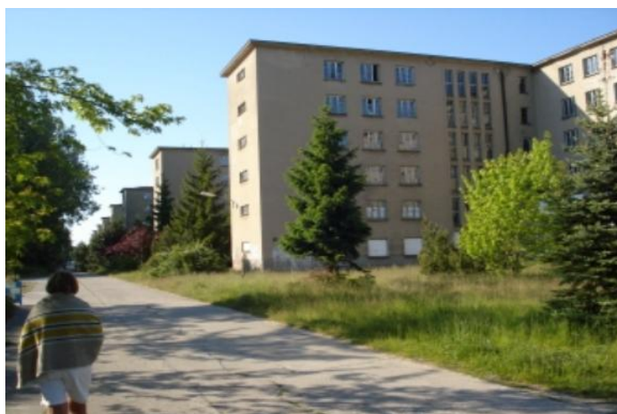
Og bagsiden – væk fra stranden. Begge billeder er blot et mindre udsnit.

Der forlyder intet officielt om, hvad man ønsker at foretage sig med husene. Da de er bygget af samme beton, som de næsten uforgængelige bunkers langs Vesterhavet, vil det være en bekostelig affære, om man beslutter at rive dem ned.