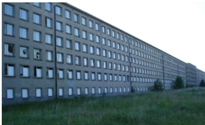
Facaden ud mod stranden

Nu ligger blokkene tomme, og smadrede vinduer og almindeligt forfald dominerer.