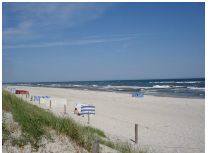
Udsnit af stranden på Rygens nordkyst