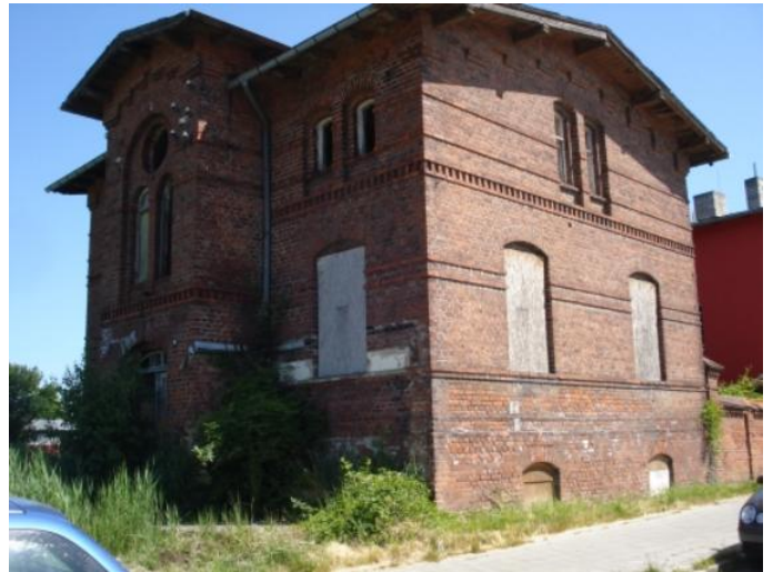
Gammel statelig bygning som næsten smuldrer

Det siger sig selv, at det var noget ubekvemt at have denne sørøverrede liggende så bekvemt for røveri i det befærdede farvand, som var tidens samfædselsrute. Men da det dels var støvte mænd, som meget få kunne leve op til når det gjaldt fysisk kraft og evne til at slås, dels var en borg med svær beliggenhed for en angriber, følte sørøverne sig rimeligt trygge.