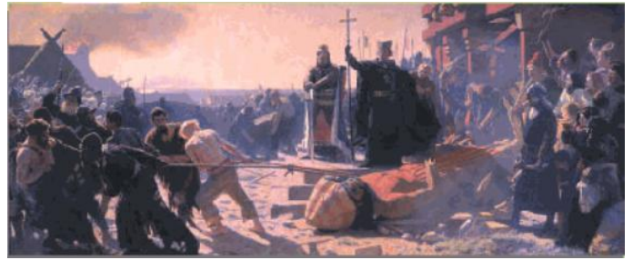
Biskop Absalon holder korset højt, mens Svantevitt slæbes ud på åben mark