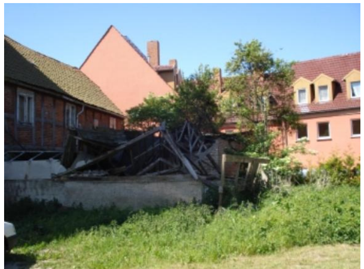
Bag de renoverede facader – falder husene sammen